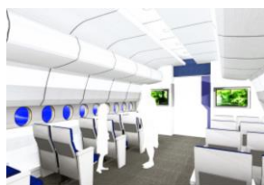
【飛行機内を模した空間】