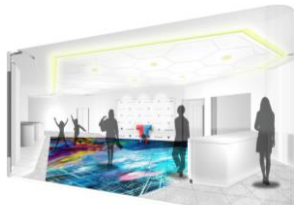
【デジタル映像による演出】